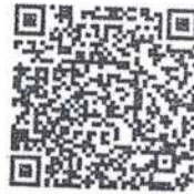
QR code เพื่อรายงานการปฏิบัติงานประจำเดือน

อำเภอบางน้ำเปรี้ยว, อำเภอพนมสารคาม, อำเภอราชสาส์น, และอำเภอท่าตะเกียบ ขอให้รายงานผลการปฏิบัติงานทุกวันที่ ๒ ของเดือนถัดไป ในรูปแบบออนไลน์ที่ https://docs.google.com/forms/d/1tFkdCiHCDbCoxZ2QildTpe_aOvHZN2MEuhkqaODMEg/viewform?edit_requested=true