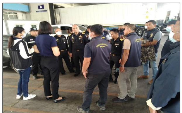
การตรวจติดตามโรงฆ่าสัตว์ ครั้งที่ ๒