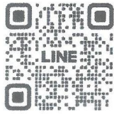
วัดอุ้มงคลหลวงปู่แสง

๓. สำนักงานพระพุทธศาสนาจังหวัดฉะเชิงเทรา ประชาสัมพันธ์การเข้าวัดอุ้มงคล เหยี่ยงหลวงปู่แสง จันตะโชโต “รุ่น สยบมารบันดารทรัพย์” เพื่อสมทบทอดผ้าป่าสามัคคี ในวันที่ ๒๒ - ๒๓ กรกฎาคม ๒๕๖๖ ซึ่งจะนำรายได้สร้างอุโบสถ เจดีย์ วัดทิพยาราม (ธรรมยุต) และบำรุงสาธารณะประโยชน์ต่างๆ ผู้สนใจสามารถส่งจองได้ที่วัดทิพยาราม (ธรรมยุต) หรือ ID Line ตาม QR Code