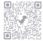
QR code รายละเอียดการดำเนินการ

ดังนั้น ขอให้แจ้งผู้ประกอบการปวงช้าง ยื่นขอรับใบอนุญาตเป็นผู้ผลิตสินค้า เกษตรตามมาตรฐานบังคับผ่านระบบ TAS-License ได้ตั้งแต่วันนี้เป็นต้นไป